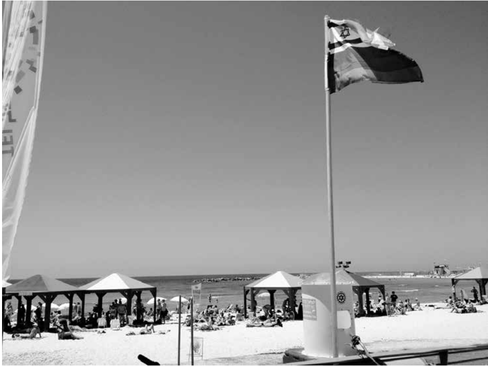
תמונה מס' 3: חוף הילטון, תל-אביב, יוני 2012