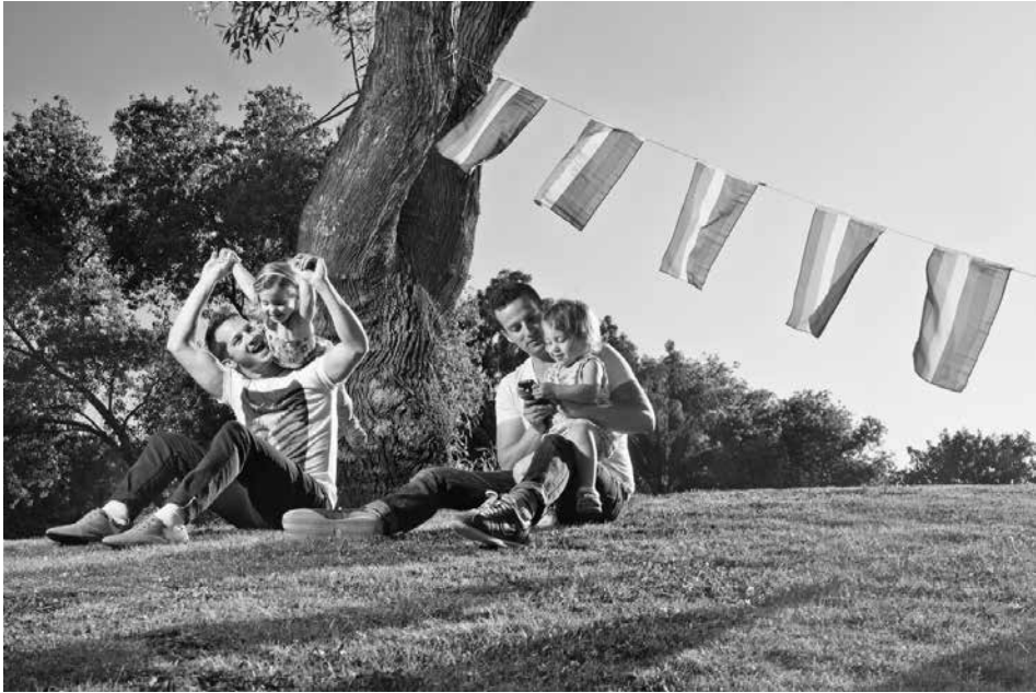
תמונה מס' 2: פוסטר מאירועי הגאווה בתל-אביב, יוני 2012, תמונה זו היתה על השלט המרכזי שניתלה לכבוד אירועי הגאווה בכיכר רבין

העבר לימד שהמקסימום שאפשר היה להשיג על פי רוב מפוליטיקאים אוהדים מהימין הוא הימנעות מתמיכה ביזמות חקיקה הומופוביות, אך האוניברסליות של גינוי הרצח יצרה חלון הזדמנויות עבור פוליטיקאים מהימין לצאת מהארון כתומכים.